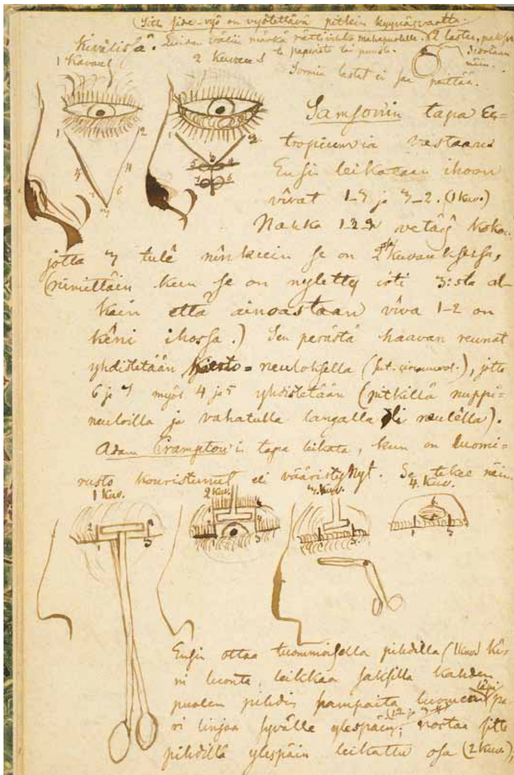
KUVA 4. Schildt oli erityisen kiinnostunut silmätaudeista. Kuvan piirrookset ovat yksityiskohtainen selvitys alaja yläluomen korjausleikkauksesta.